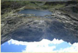
Pantano del Burguillo