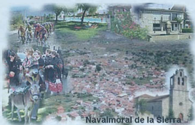
Navalmoral de la Sierra